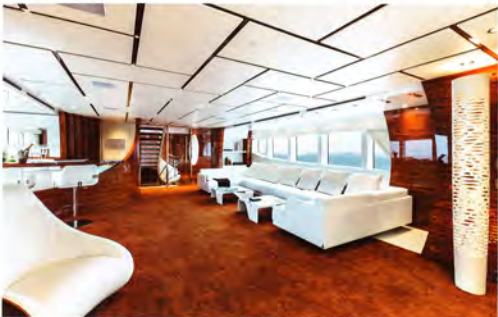
Eignerlounge auf dem Oberdeck: Sofa und Bar laden zur Entspannung (oben). Überall an Bord finden Gäste Ruheräume.

S port Fishermen, schnelle Sportboote und klassische kleinere Verdänger, so setzte sich bisher das Portfolio der Istanbuler Werft zusammen. Mit der Vulcan-Serie stieg sie in die Welt